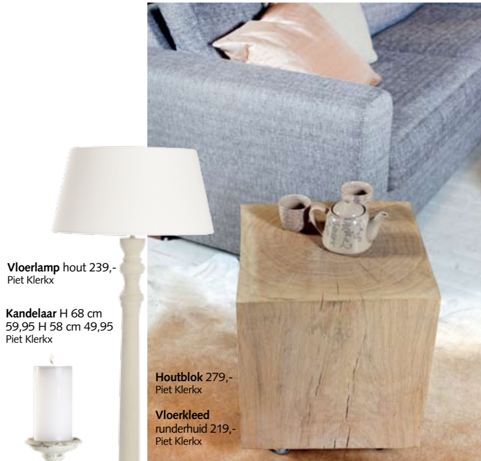
Vloerlamp hout 239,- Piet Klerkx

In alle luxe lijkt de natuur bijna vergeten. Dat is slechts schijn. De natuur is alleen minder zichtbaar. Hout hoort in deze stijl, maar zit vaak onder een laagje luxe in de vorm van verf of lak. Materialen en stoffen moeten een 'bewijs van goed milieu' dragen. Dan pas is Natural Lifestyle ook echt natuurlijk wonen.