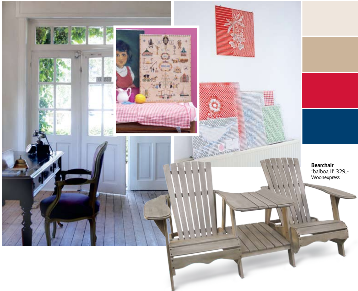
Bearchair 'balboa II' 329,- Woonexpress