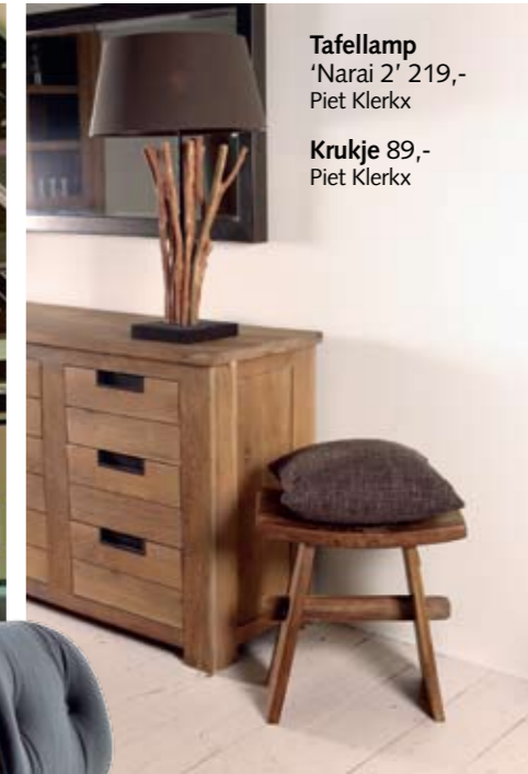
Tafellamp 'Narai 2' 219,- Piet Klerkx Krukje 89,- Piet Klerkx