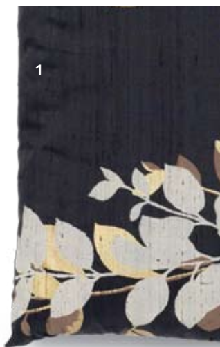
1 Kussens diverse varianten v.a. 9,95 (excl. vulling) Piet Klerkx en Woonexpress 2 Dekbedovertrekset diverse maten 140x200/220 cm 29,50 Woonexpress Sfeerbeeld linkerpagina Bijzettafeltje 'Piazza' set van twee 99,- Woonexpress Behang (101Woonideeën) Praxis Sfeerbeeld rechterpagina Bladornament 'Maria' (Casamania) 95,- Riant - Stoutenbeek Fauteuil 'Rosa' in stof Vitas 329,- Piet Klerkx

Binnen trends zijn altijd ontwerpers die zich onderscheiden. Missoni doet dat binnen de trend van natuurlijk wonen. Het hippe merk kiest voor de natuur, maar op een eigenzinnige manier. Opvallend is de print van Missoni met cactussen, bijzonder vormgegeven en in spannende kleuren. Niet alleen in groen, maar ook in knalgeel en hardroze. Een ontwerp voor wie trendgevoelig is, maar zich toch wil onderscheiden. Voor wie dat niet wil, is natuurlijk wonen op een eenvoudige manier te bereiken. Een vergroting van een mooie foto van een bloesemtak aan de muur. Een paar mooie grote vazen met pioenrozen of kersenbloesem erop. Leuke kussens met bladmotief op de bank en de natuur is in huis. En echte planten horen daarbij. Grote potten met grote planten maken het interieur af.