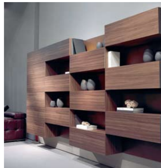
Boven Entree Salone del Mobile Rechtsonder Kastensysteem Durini van Natuzzi. Modules in verschillende houtsoorten en laklagen