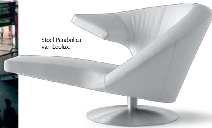
Stoel Parabolica van Leolux.